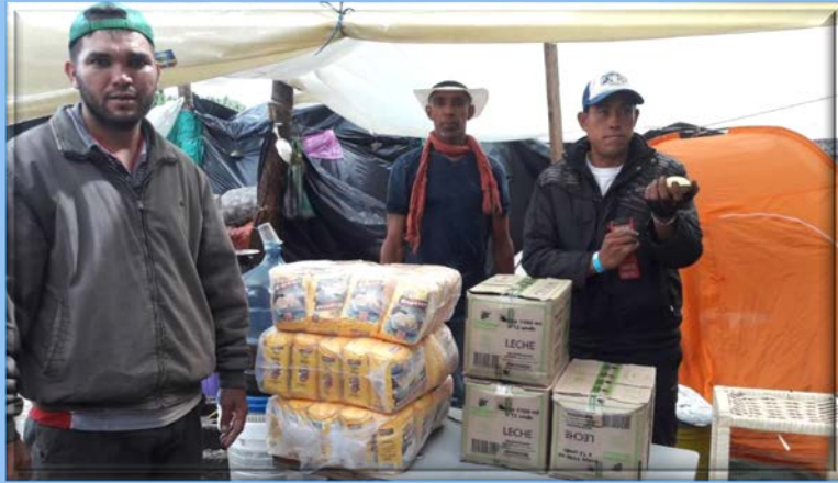
Apoyo a Migrantes Venezolanos: Aporte de Leche y Harina Pan, en el campamento de migrantes, ubicado al lado del terminal de transportes de la ciudad de Bogotá.