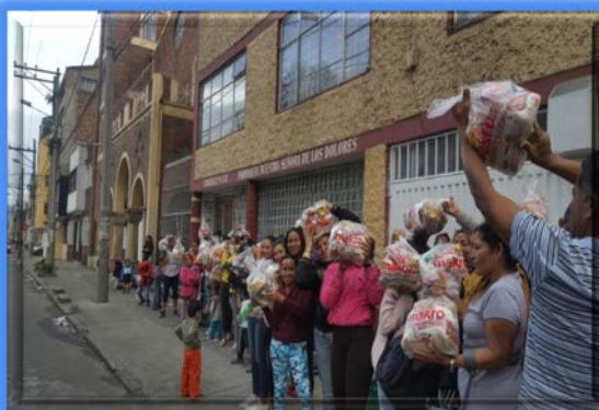
Mercados a migrantes en la Iglesia de los Dolores, en el barrio San Bernardo de la ciudad de Bogotá